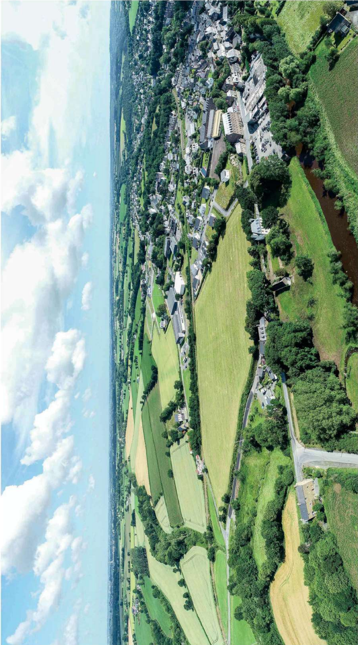
PHOTOGRAPHIE LOINTAINE PC8