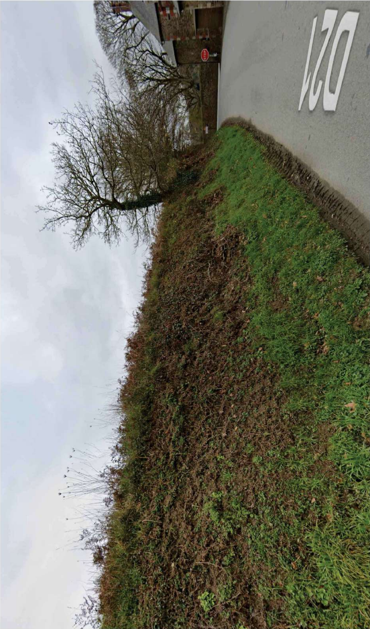
PHOTOGRAPHIE PROCHE PC7